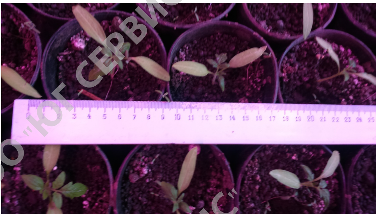
Рисунок 3 – Растения томата после проведения пикировки на 3 день (5.11.2016).