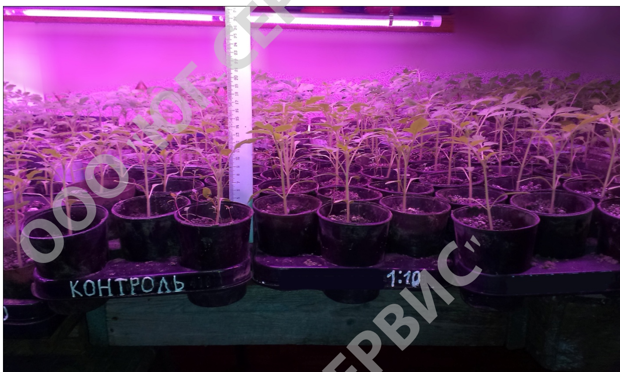
Рисунок 4 – Развитие растений томата на 15.11.2016.