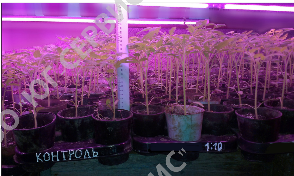
Рисунок 5 – Развитие растений томата на 20.11.2016.