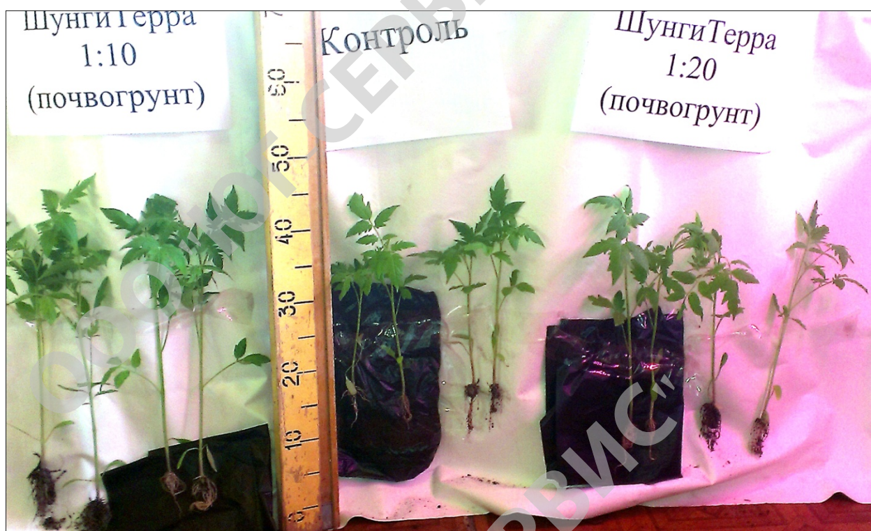
Рисунок 7, 8, 9,10 – Развитие растений на 46 день после посева семян