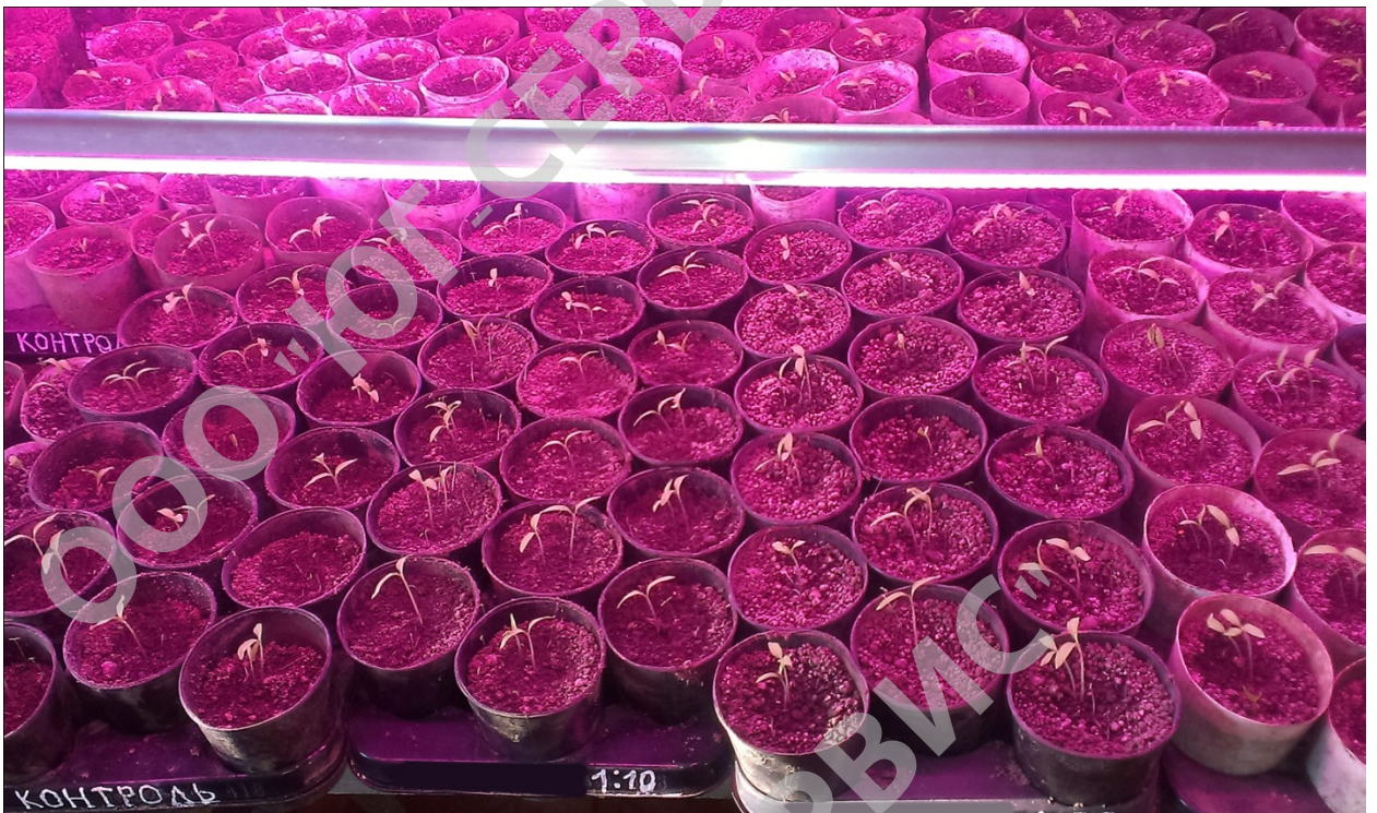
Рисунок 2 – Всходы томата 24.10.2016.