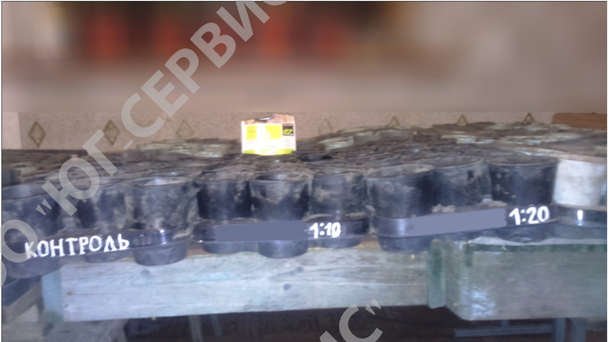
Рисунок 1 – Посев томата