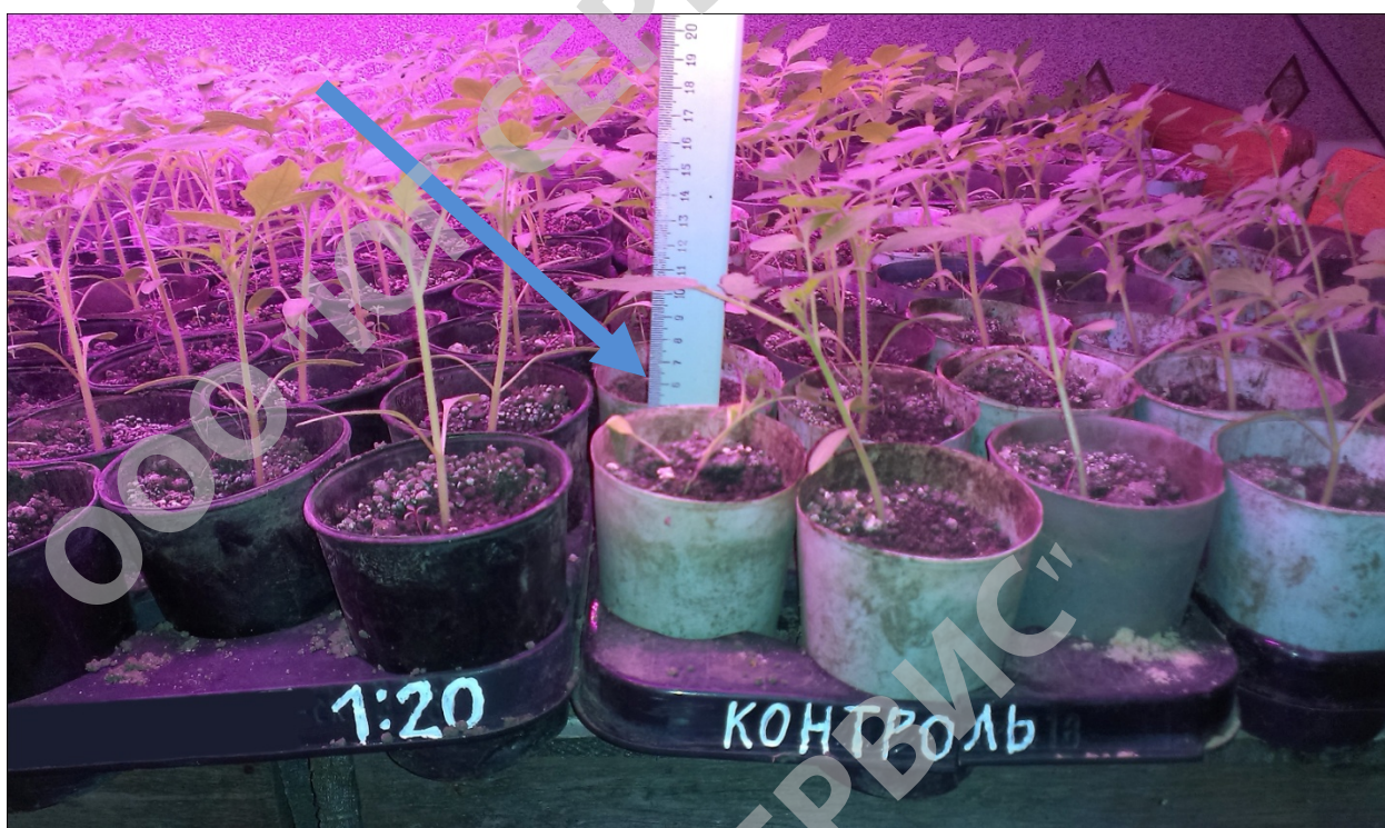
Рисунок 6 – Гибель растения томата от «черной ножки» на 15.11.2016.